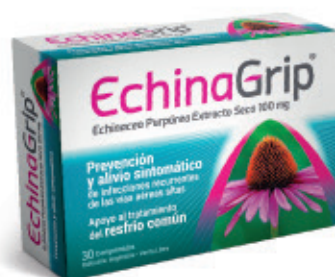
Comprimidos x 30

Echinacea Purpúrea Extracto Seco 100 mg Echinacea Purpúrea Tintura Madre 100 mg/ml