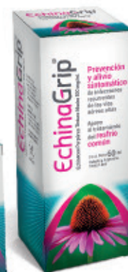
Tintura Madre x 60 ml

Propiedades farmacológicas: Su actividad se explica por una estimulación del sistema inmunitario, contribuyendo a combatir las infecciones y estimulando las respuestas inmunes.